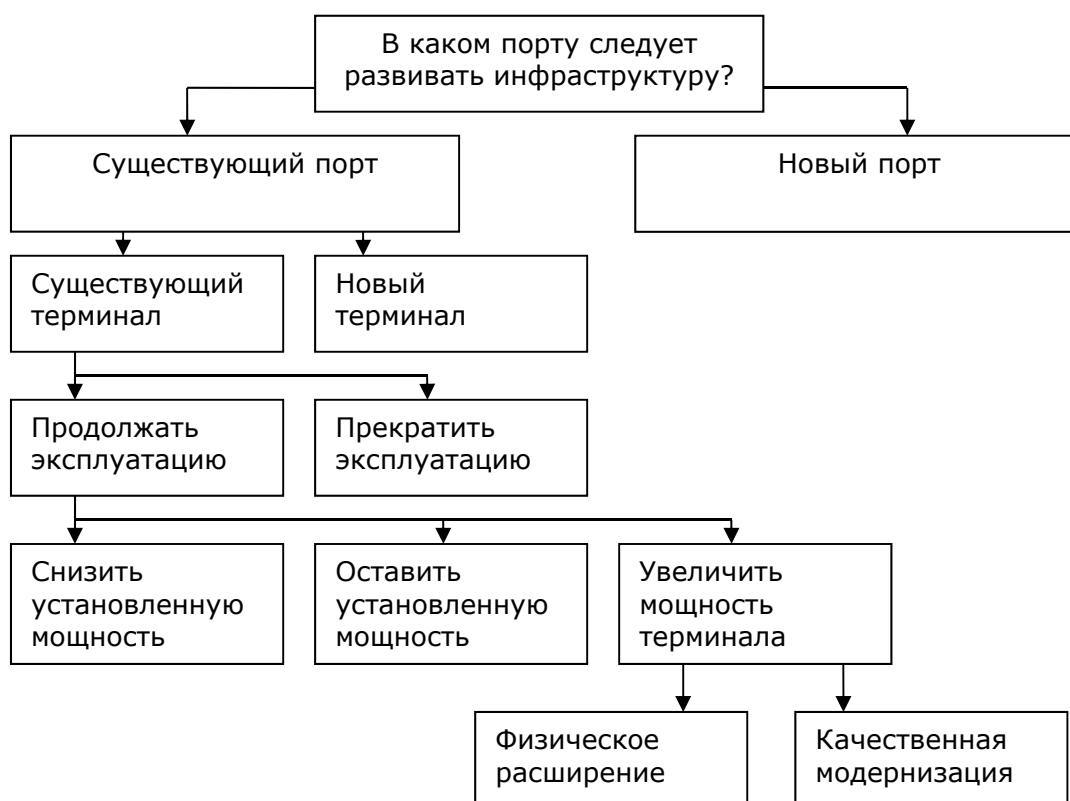
Рис. 1 Дерево разработки стратегических направлений

На первом уровне происходит выбор между существующими и новыми портами. В случае если есть более подходящее доступное местоположение для развития портов на российской береговой линии, чем существующие порты, или когда существующие порты не могут развиваться, образование новых портов может быть рассмотрено.